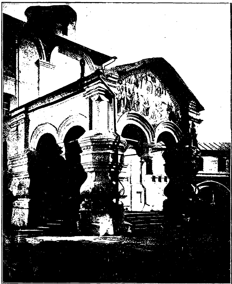
Входъ въ главный соборъ Сласо-Прилуцкаго монастыря.